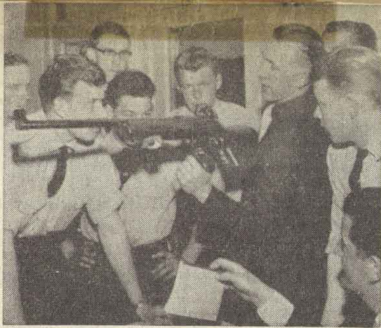
Mange var interesseret i skytteforeningens virksomhed